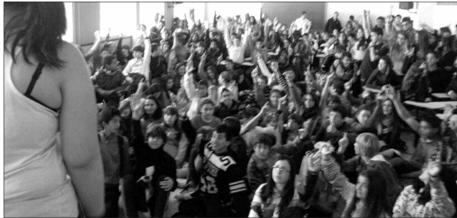
Asamblea de estudiantes en el IES Miraya del Mar (Málaga) aprobando salir a la huelga general

Nuestros locales se convirtieron en verdaderos centros de comunicaciones y de organización, donde todas las tardes se realizaban reuniones informativas además de cientos de llamadas a los afiliados, simpatizantes y estudiantes que durante los últimos meses se estaban organizando con nosotros. Con menos de tres semanas de margen decidimos editar unos 30.000 carteles, 20.000 pegatinas y más de 150.000 panfletos. Esta ingente cantidad de material lo distribuimos por todo el Estado con rapidez, además de las miles de hojas que estudiantes desde sus casas imprimieron desde nuestra página web