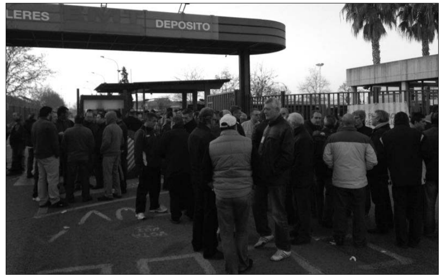
Exterior de las cocheras de la EMT durante la huelga general del 29-M

Esta crème de la crème de la burguesía valenciana es la que tiene que negociar el nuevo convenio colectivo. El Comité de Empresa, a principios de noviembre de 2011, denuncia el vigente para iniciar la negociación del convenio de 2012. Sin ninguna prisa, contestación, ni interés por parte de la empresa hasta el 21 de febrero de 2012, día en que se celebra la primera reunión. En esta primera reunión la empresa presenta sus propuestas, además, el señor Bernabé ya advierte, en tono chulesco, que no va a pagar la paga de marzo, y así sucede. Sus propuestas no son otras que la de reducir salario de forma drástica