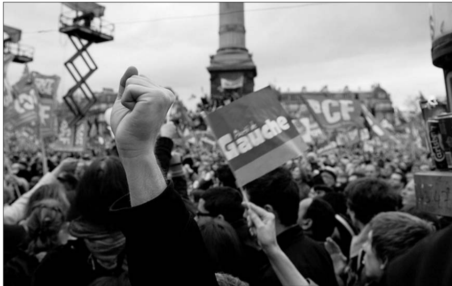
Manifestación del Frente de Izquierdas (Front de Gauche) el pasado 18 de marzo

Merah fue localizado en su piso de Toulouse y después de varios días de asedio por parte de las fuerzas especiales, finalmente fue "abatido" por la policía. Pero cuantos