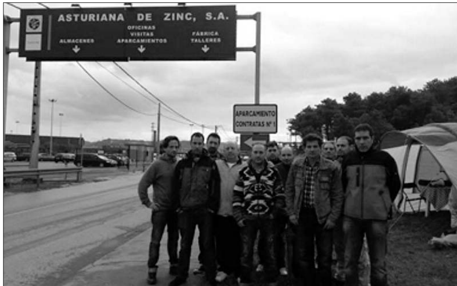
Varios de los trabajadores de IMSA intoxicados, durante la huelga de hambre a las puertas de AZSA

En el caso de los intoxicados de IMSA, también en el hospital se actuó con una negligencia asombrosa. El mercurio es un me-