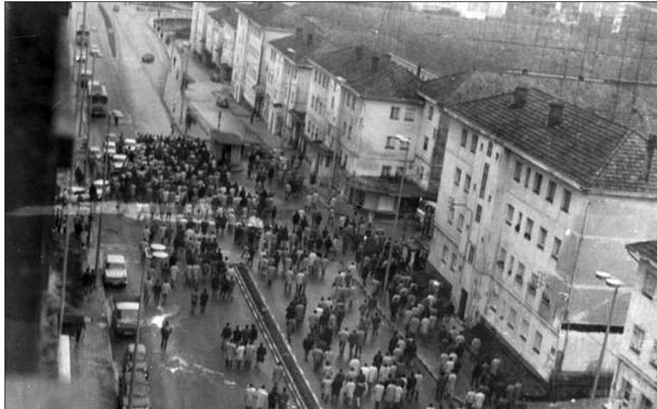
Una de las pocas imágenes que se conserva (si no la única) del 10 de Marzo

Tras abandonar la lucha guerrillera, el PCE se centra en la tarea de asentarse en los centros de trabajo. Esto acaba por conducir a que el VI Congreso del PCE (diciembre 1959 - enero 1960) decida una nueva estrategia sindical: la penetración del Sindicato Vertical franquista. Las huelgas en las minas asturianas en la primavera de 1962 ven la formación de la primera comisión obrera, que en principio surgen para representar genuinamente los intereses de los trabajadores al calor de una lucha y que se disuelven tras finali-