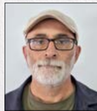
Roberto Candal Enxeñería Turbinas