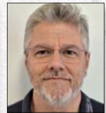
Valentín Carballeira Enxeñería Turbinas