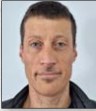
Vicente Ferrer Elaborado