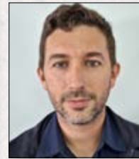
Pablo Bordello Turbinas