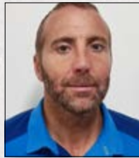
Paco Naveiras Xestión Producción