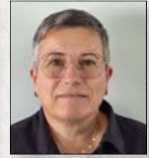
Chus Yáñez Loxística Fabricación