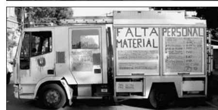
Dos imágenes del interior de los camiones: tapicería y palanca de cambios en mal estado. Debajo, uno de los camiones pintados denunciando su situación.

RM.— Le mandamos desde aquí nuestra solidaridad y el material que me entregais lo haré llegar a mis compañeros.