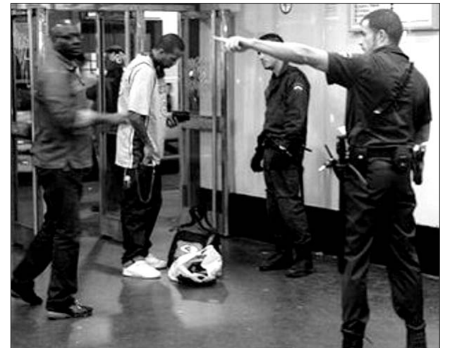
Izquierda: explotación infantil en India; derecha: redada racista en el Metro de Madrid

tre 1986 y 1999 hubo 396 ventas y transferencias del sector privado; el 57% de estas privatizaciones fueron en el sector de los servicios públicos, y las empresas españolas fueron las grandes beneficiadas de estas privatizaciones a precio de saldo. Un claro ejemplo fue Argentina que, durante el gobierno de derechas de Carlos Menem, privatizó más de 60 empresas públicas; entre ellas la petrolera YPF, la telefónica ENTEL y Aerolíneas Argentinas, que fueron adquiridas a precios muy ventajosos por Repsol, Telefónica e Iberia.