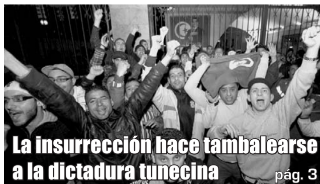
La insurrección hace tambalearse a la dictadura tunecina