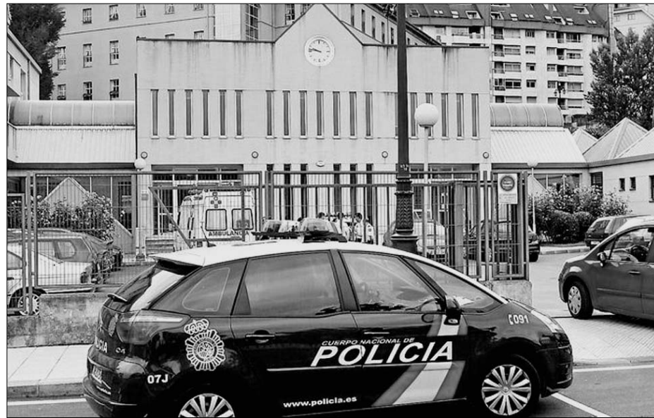
Un coche de la policía nacional, frente al Centro Materno Infantil

Sin embargo, ni la prensa oficial, ni el gobierno, ni las asociaciones de vecinos hablan de la situación que padecen estos menores de entre 0 y 18 años, sean extranjeros o no, en los centros de acogida donde muchas veces viven en condiciones pésimas y hacinados durante largos periodos de tiempo. Constantemente la capacidad del centro se ve desbordada y la plantilla no da abasto. En 2008 se produjeron una serie de protestas, entre ellas un encierro en el Materno, por parte de los trabajadores del centro y el comité de empresa denunciando estos recortes y exigiendo que los responsables po-