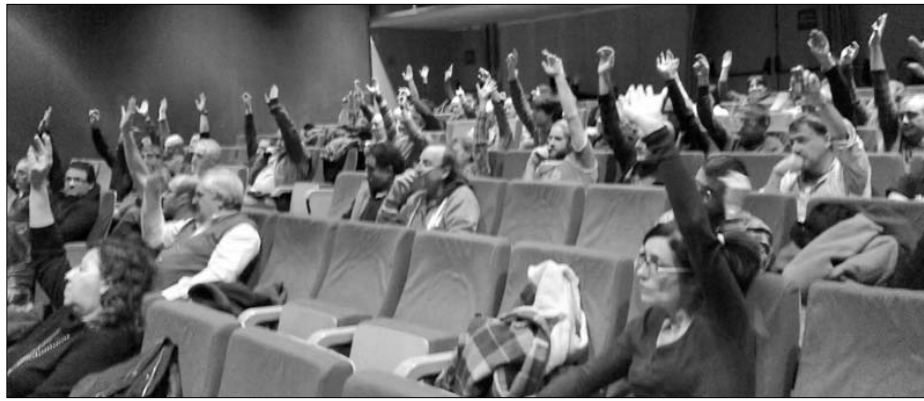
Plataforma de Comités de Empresas de Alava en defensa del empleo

El PNV presume con la boca grande de defender la autonomía vasca frente a las intromisiones del Estado español, pero cuan-